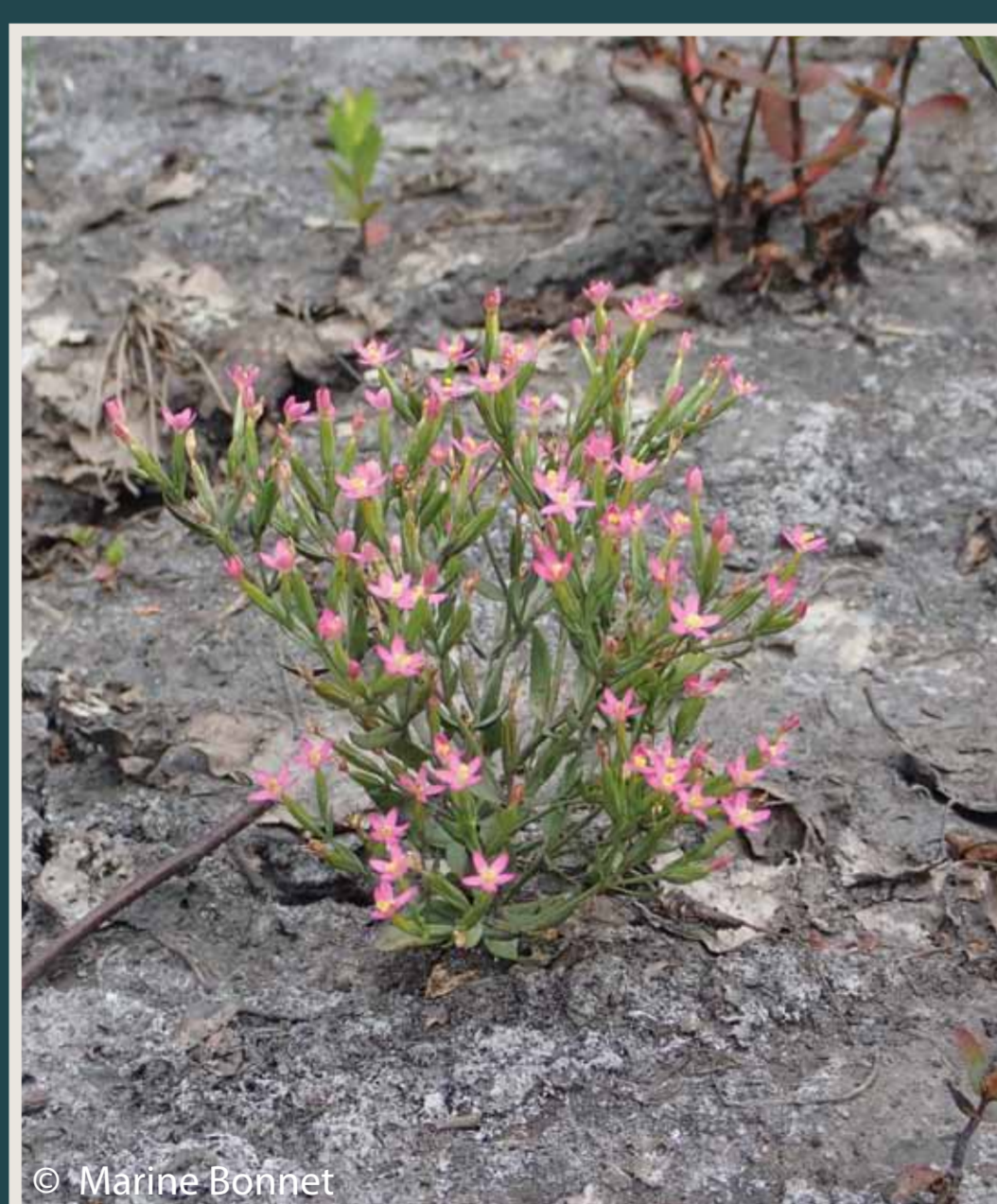
Erythrée petite centaurée ( Centaurium erythraea )