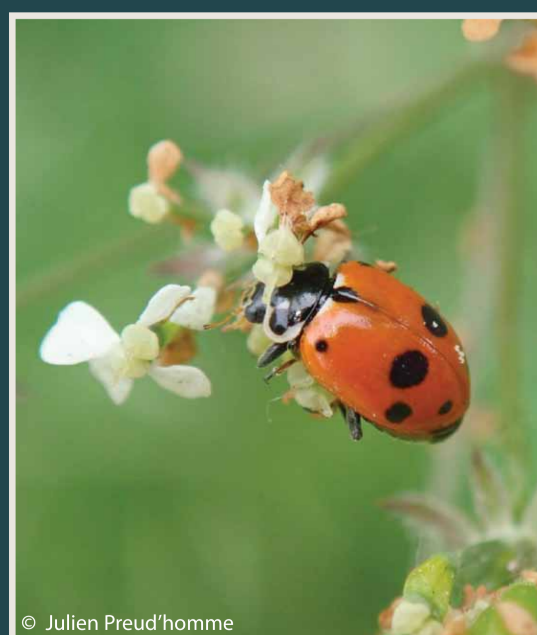
Coccinelle des friches ( Hippodamia variegata )