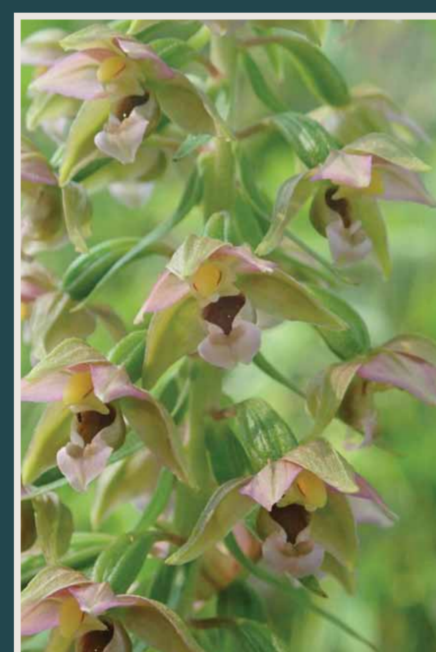
Epipactis à larges feuilles ( Epipactis helleborine )