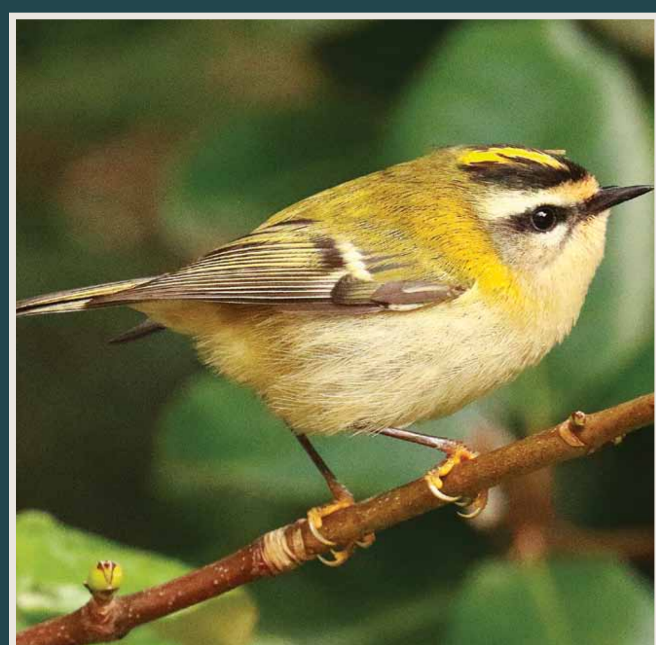
Roitelet à triple bandeau ( Regulus ignicapilla )